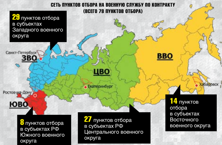
СЕТЬ ПУНКТОВ ОТБОРА НА ВОЕННУЮ СЛУЖБУ ПО КОНТРАКТУ (ВСЕГО 78 ПУНКТОВ ОТБОРА)

Для поступления на военную службу по контракту в первую очередь необходимо обратиться в пункт отбора на военную службу по контракту. Пункты отбора созданы в большинстве субъектов Российской Федерации от Калининграда до Владивостока.